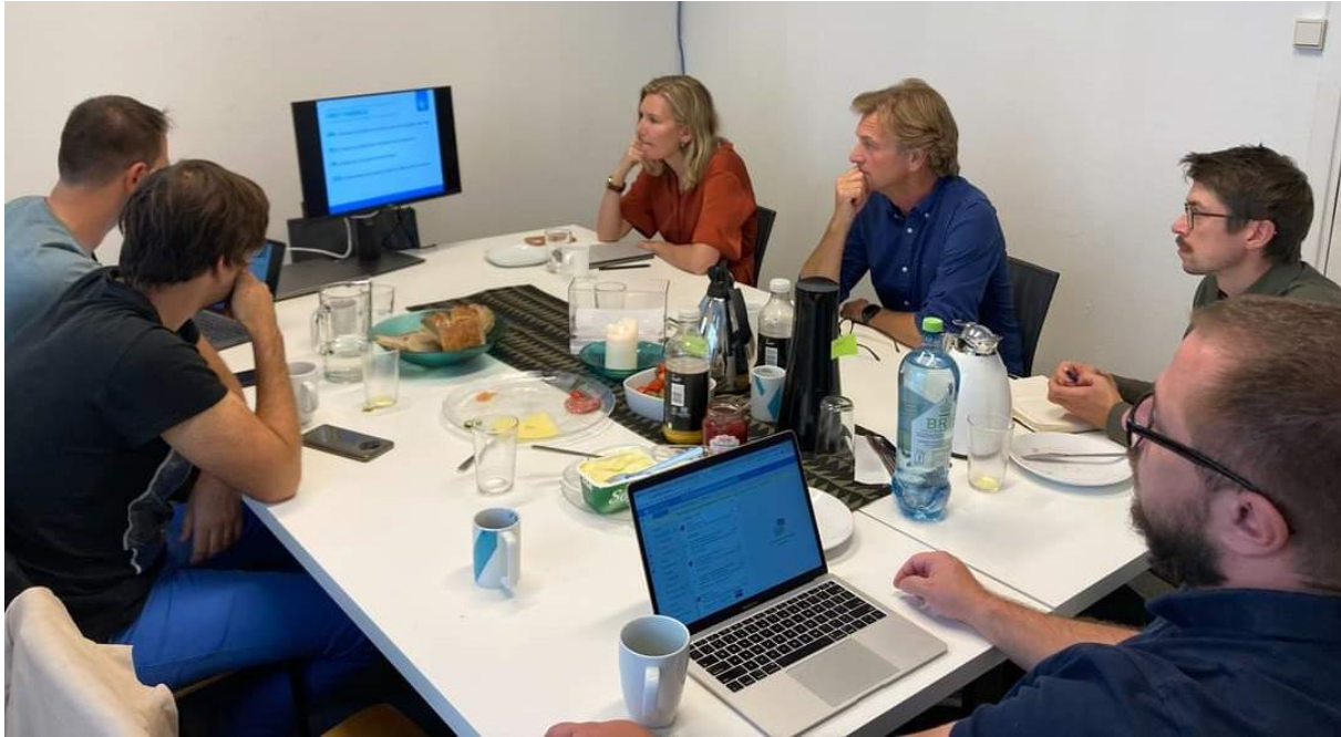
Besøk fra TI Slovakia i Oslo i august

TI Norge deltok på en dagskonferanse i Bratislava 14. juni med eksperter fra en rekke europeiske land. TI Slovakia var på todagers gjenbesøk i Norge i august. Samarbeidet har avdekket at mange europeiske land har kommet lenger enn Norge i å sørge for åpne databaser om eierskapsforhold i næringslivet og åpenhet om leverandører til det offentlige.